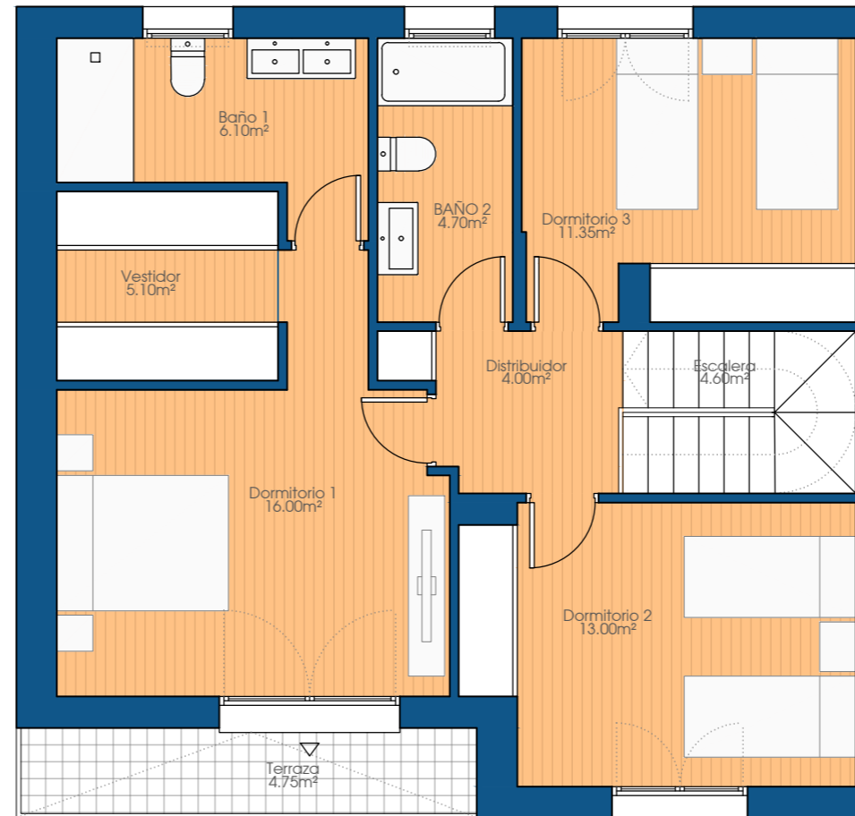
PLANTA PRIMERA Sup. construida = 80.40m 2